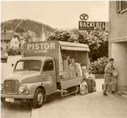
↑ Mit solchen Camions lieferte Pistor im Jahr 1964. Insgesamt besass Pistor damals 11 Fahrzeuge.

Change Management – ein Begriff, den du sicher schon gehört hast und der auch Pistor beschäftigt, denn unser Unternehmen verändert sich laufend. Wir werfen einen Blick auf verschiedene Aspekte des Themas.