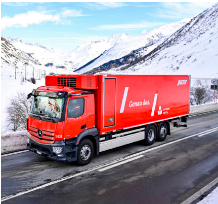
↓ Heutige Pistor Lkws besitzen Abbiege-, Brems- und Abstandsassistenten, Verkehrszeichenerkennung, Kameras statt Aussenspiegel und mehr.